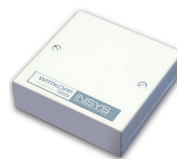
Rozšiřující jednotka pro síťové propojení Twin IP

Technické změny a omyly vyhrazeny. ©Copyright 10/2009 FestTech, s.r.o.