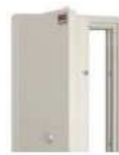
Certifikované zabezpečení proti násilnému vniknutí a proti ohni

Trezorové místnosti s trezorovými dveřmi mohou být dodány například do maloobchodních prodejen, společností přepravujícím hotovost, bankám, dalším typům společností i soukromým zákazníkům.