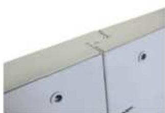
Zvýšená bezpečnost – panely zapadající do sebe