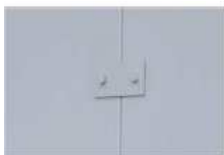
Jednoduchá instalace sešroubováním nebo svařením